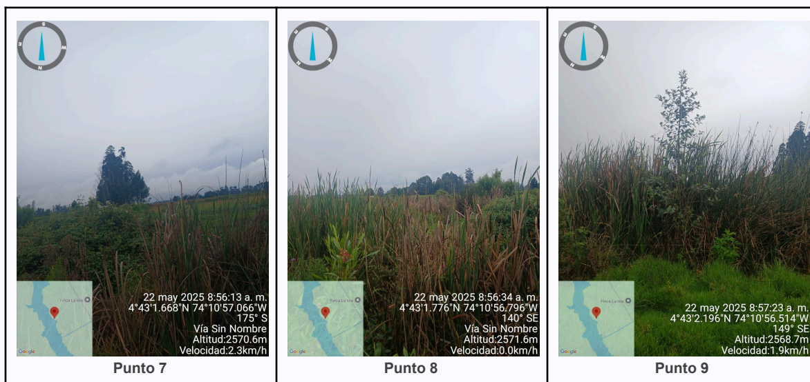
Ilustración 2. Fotos de los puntos del Recorrido de Control Y Vigilancia Ronda Del Humedal Gualí.